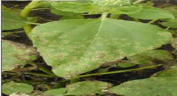
شکل ۱. اعلام اولیه بیماری سوختگی برگ آفتابگردان

علائم بیماری بعد از گلدهی آفتابگردان، به سرعت توسعه می یابد. لکه ها روی گیاهچه نیز تشکیل می شوند. این بیمارگر در آب و هوای گرم و خشک، غیرفعال و در مزارع مناطق خشک کمتر مشکل ساز می شود.